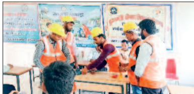
आपूर्ति व्यवस्था के संचालन एवं रखरखाव के लिए स्थानीय युवाओं को तकनीकी रूप से सक्षम बनाना है। 11 मार्च जल उत्सव पखवाड़ा कार्यक्रम

बेमेतरा। कौशल विकास तकनीकी शिक्षा एवं रोजगार विभाग द्वारा संचालित मुख्यमंत्री कौशल विकास योजना के अंतर्गत जिला परियोजना लाइवलिहुड कॉलेज बेमेतरा में जल जीवन मिशन के तहत चयनित ग्रामों के युवाओं को नलजल मित्र कार्यक्रम के अंतर्गत बहु-कौशल प्रशिक्षण प्रदान किया जा रहा है। यह प्रशिक्षण जिला कंवेन्टर के मागदेशन में लोक स्वास्थ्य यांत्रिकी विभाग तथा पंचायत एवं ग्रामीण विकास विभाग के समन्वय से संचालित किया जा रहा है। कार्यक्रम का मुख्य उद्देश्य ग्राम स्तर पर जल